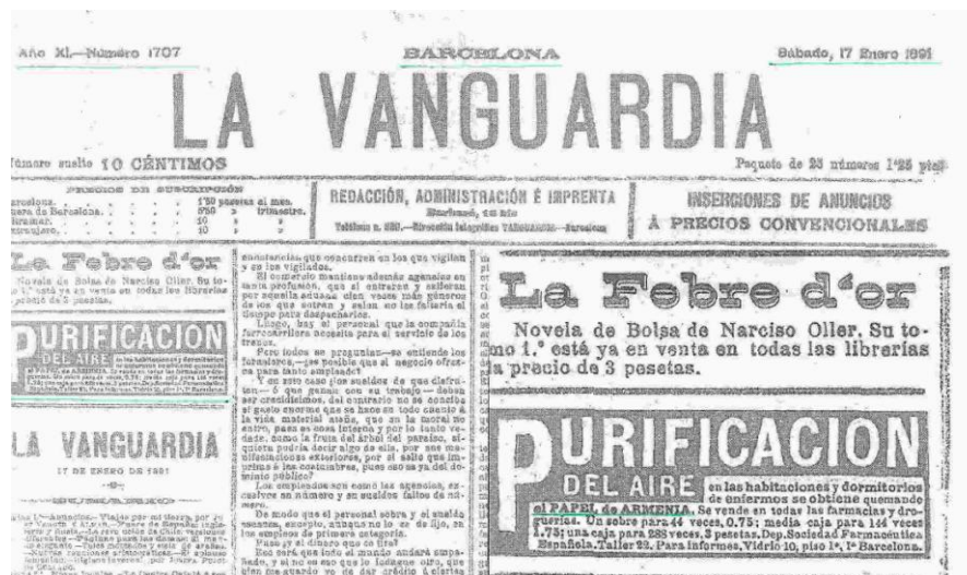
La Vanguardia del 17 de enero de 1891

“Purificación del aire en las habitaciones y dormitorios de enfermos se obtiene quemando el Papel de Armenia. Se vende en todas las farmacias y droguerías. Un sobre para 44 veces, 0,75; media caja para 144 veces 1,75; una caja para 288 veces, 3 pesetas. Departamento Sociedad Farmacéutica Española. Taller 22. Para informes, Vidrio 20, piso 1ro, Ira Barcelona.”