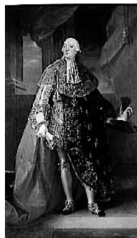
TESTIGOS. José Bonaparte y el Duque de Chartres. /L.V.