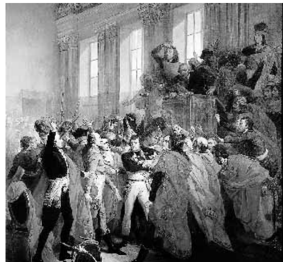
ASAMBLEA. Los 'revoltosos' del XVIII, con Philippe Égalité.

José Bonaparte no puede evitar que su miedo y sus peores presagios se intuyan en la urgencia de sus palabras. Le pide que se reúna con él «en cuanto lea la presente, con todas sus tropas, sean cuales sean las órdenes que haya recibido (...) en nombre del honor; el deber y la obediencia que usted me debe y que no le permiten quedarse en Cuenca mientras marchan hacia aquí los ingleses».