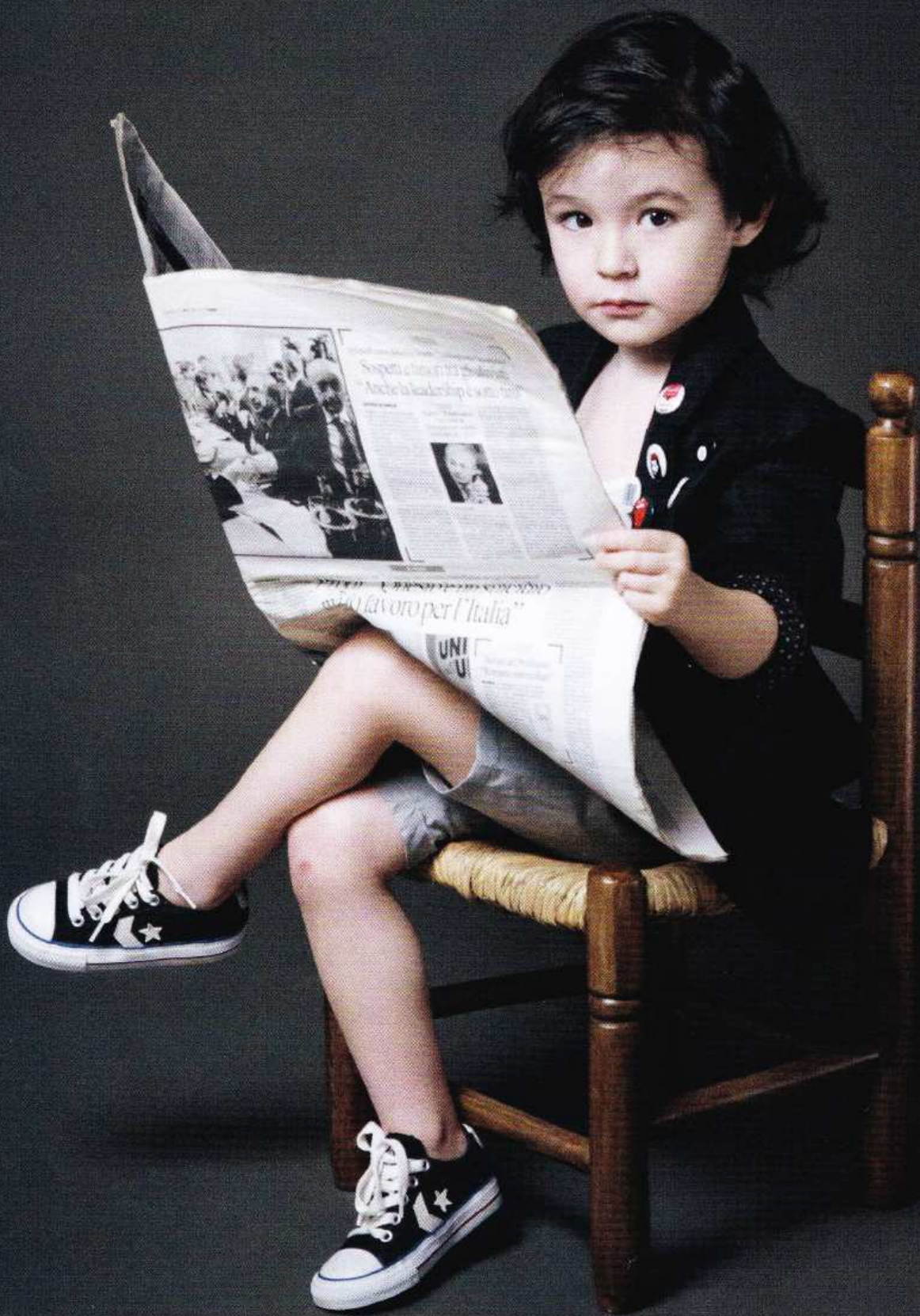
CHAQUETA ANIK BATH, CAMISETA PETIT BATEAU, PANTALÓN VIOLETA & FEDERICO, ZAPATILLAS CONVERSE ALL STAR