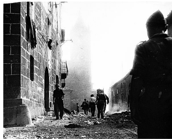
Siétamo, 1937. ■ CENTELLES