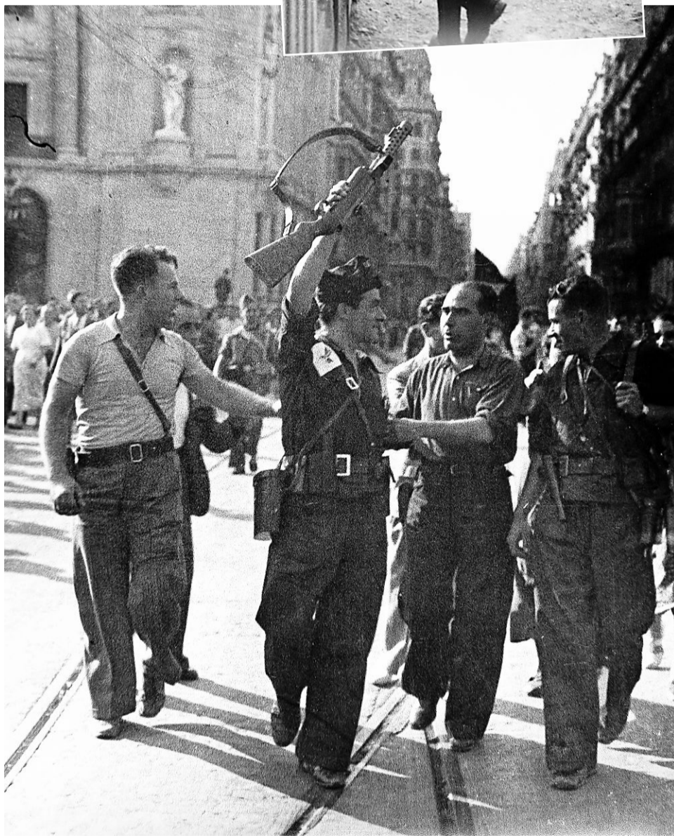
Arriba, campo de concentración de Bram. Abajo, salida de la columna García Oliver. ■ LP Monte Aragón. ■ CENTELLES