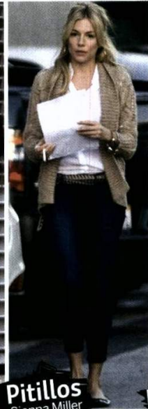
Pitillos Sienna Miller