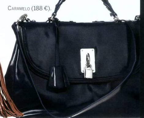
CARAMELO (188 €).