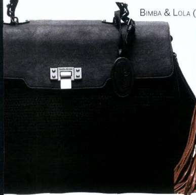
BIMBA & LOLA (115 €).