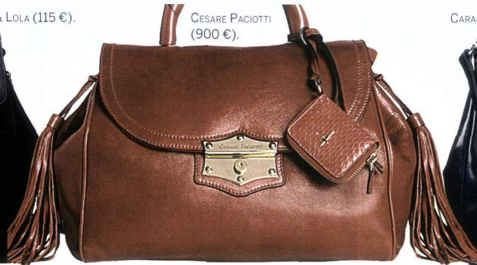
CESARE PACIOTTI (900 €).