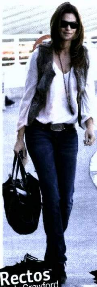
Rectos Cindy Crawford

ELLAS SABEN ELEGIR EL FITTING QUE MEJOR LES SIENTA.