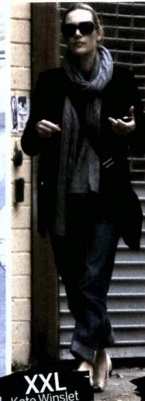
XXL Kate Winslet