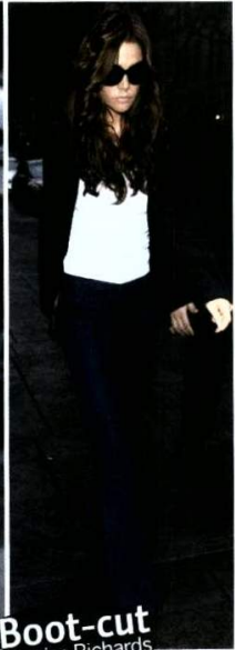
Boot-cut Denise Richards