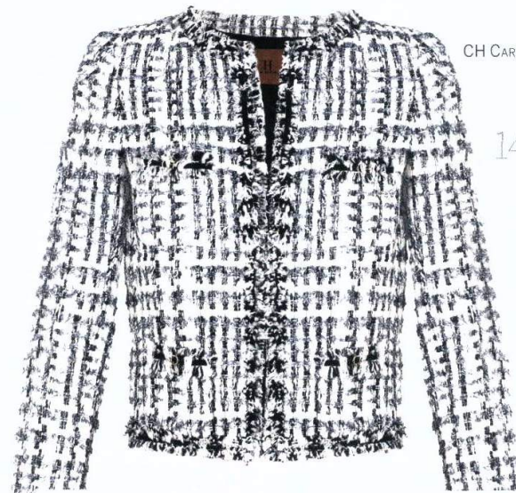
CH CAROLINA HERRERA (650 €).