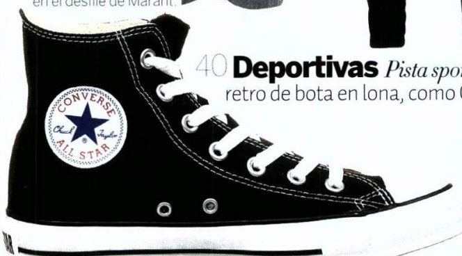
Zapatillas ALL STAR CONVERSE (70 €).

40 Deportivas Pista sport-à-porter: Elige diseños retro de bota en lona, como Converse o Feiyue.